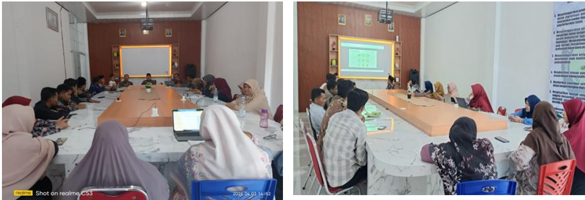
Gambar 2. Kegiatan Pelatihan

Pelaksanaan kegiatan pengabdian kepada masyarakat berupa pelatihan penyusunan perangkat ajar Kurikulum Berbasis Cinta di MA Al-Kifayah Riau menunjukkan hasil yang signifikan dalam meningkatkan kompetensi pedagogis guru. Hasil ini diperoleh melalui analisis data kuantitatif yang bersumber dari angket pre-test dan post-test, serta didukung oleh data kualitatif dari observasi dan wawancara.