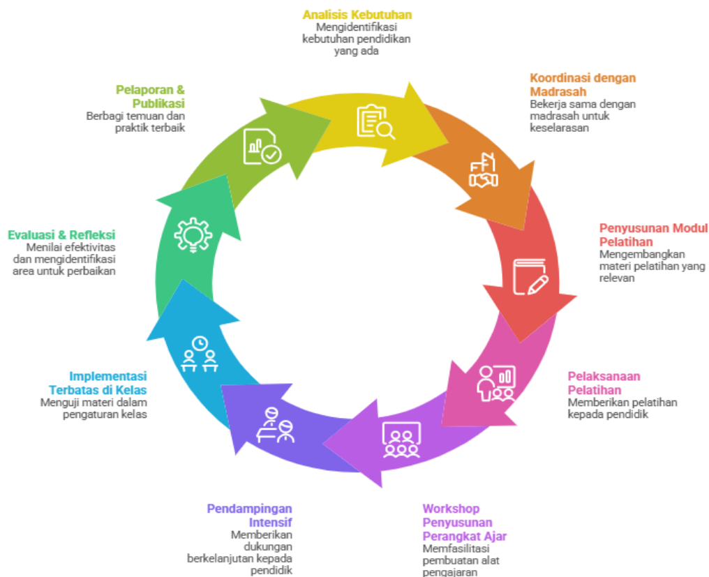
Gambar 1. flowchart kegiatan PKM

Berikut alur kegiatan pengabdian secara sistematis: