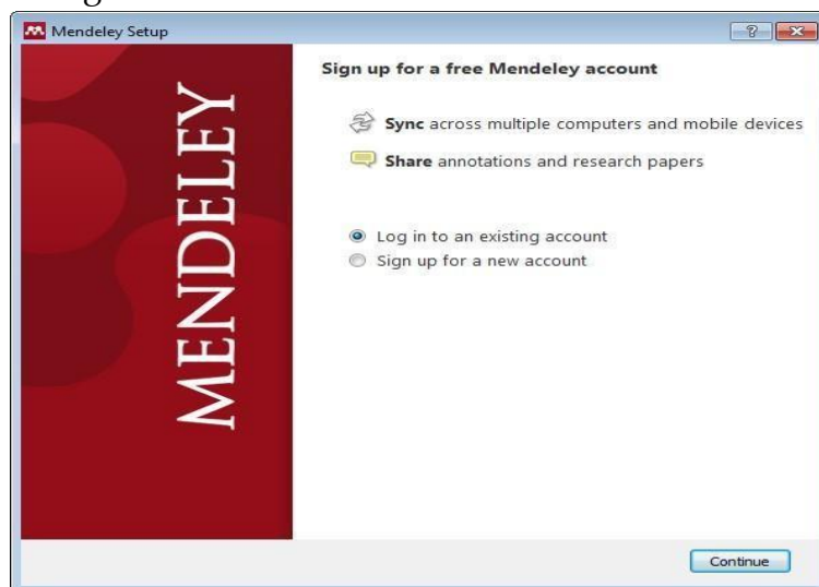
Gambar 4. Tampilan awal Mendeley

Gambar 3 memperlihatkan pemateri menjelaskan langkah instalasi Mendeley dan Zotero. Mulai cara mendownload sampai instalasi ke perangkat komputer secara gratis. Menjelaskan cara download Mendeley desktop untuk windows dan run Mendeley desktop sampai aplikasi Mendeley dapat digunakan. Kemudian pemaparan selanjutnya cara mengunduh aplikasi Zotero, instal aplikasi Zotero, install Zotero connector, dan menghubungkan dengan Microsoft Word.