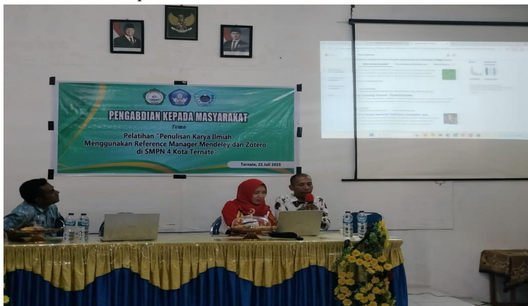
Gambar 7. Peserta mempresentasikan karya ilmiah mini dan langsung mempraktekkan cara sitasi menggunakan Mendeley dan Zotero kepada peserta yang lain

Gambar 7 tersebut menampilkan peserta dalam penyampaian hasil karya ilmiah mini mulai dari tahap awal sampai tahap akhir. Sekaligus mempresentasikan sistematika penulisan karya ilmiah dengan menggunakan sitasi reference manager Mendeley dan Zotero. Gambar ini memperlihatkan peserta yang mengikuti pelatihan mulai dari pertemuan pertama dan kedua dapat memotivasi dirinya sendiri, serta mempunyai keberanian untuk mempresentasikan hasil tulisan karya ilmiah dengan cara