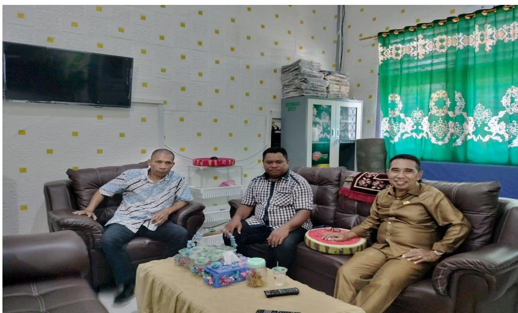
Gambar 2. Pra-kegiatan pengabdian Masyarakat

Pertemuan pertama pengenalan penggunaan Mendeley dan Zotero kepada guru-guru. Pemateri mengenalkan dan menyampaikan beberapa langkah-langkah penggunaan kedua reference manager. Software mendeley tersedia untuk sistem operasi Windows, Macintosh dan Linux. Software ini bisa didownload secara gratis melalui website: www.mendeley.com . Sedangkan software Zotero bisa akses melalui https://www.zotero.org/download/ . Materi yang disampaikan pada pertemuan pertama ini dimulai dari tahap instalasi Mendeley dan Zotero dari awal sampai tahap akhir.