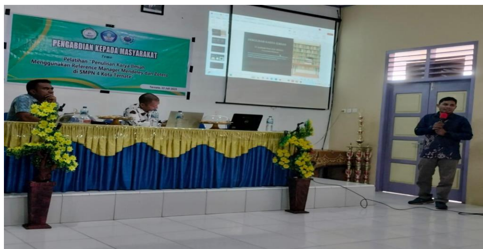
Gambar 6. Penjelasan narasumber tentang sistematika penulisan karya ilmiah

Gambar 5 tersebut menampilkan antarmuka utama aplikasi Zotero, sebuah reference management tool yang digunakan untuk mengorganisasi, menyimpan, dan mengelola sumber rujukan akademik secara sistematis. Pada halaman awal terlihat pesan sambutan ( Welcome to Zotero! ) yang memberikan panduan awal kepada pengguna mengenai langkah-langkah memulai, seperti membuka Quick Start Guide dan memasang Zotero Connector agar referensi dari web dapat ditambahkan secara otomatis ke dalam pustaka digital. Selain itu, terdapat instruksi untuk melakukan sinkronisasi ( Set up syncing ) yang memungkinkan pengguna mengakses dan memperbarui database referensi di berbagai perangkat secara real time. Antarmuka yang sederhana menampilkan struktur library di sisi kiri, area utama untuk menampilkan isi koleksi pada bagian tengah, dan kolom rincian metadata referensi di sisi kanan. Komposisi visual ini menggambarkan orientasi Zotero pada kemudahan penggunaan, efisiensi pengelolaan referensi, serta kemampuan integrasi dengan aktivitas penelitian.