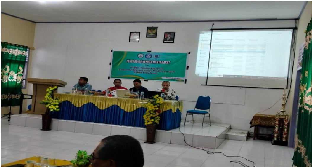
Gambar 3. Penjelasan narasumber tentang cara instal Mendeley dan Zotero dan menghubungkan ke Microsoft Word.

Gambar 2 memperlihatkan koordinasi dengan kepala SMPN 4 Kota Ternate Provinsi Maluku Utara. Pertemuan ini dilakukan secara tatap muka langsung dengan pihak kepala sekolah untuk menyampaikan rencana pelaksanaan kegiatan tersebut.