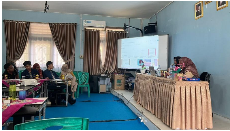
Gambar 1. Pelaksanaan Pelatihan Menulis Karya Ilmiah

Terlihat pemateri memberikan arahan kepada guru-guru dalam penulisan karya ilmiah. Pada kegiatan tersebut peserta sangat antusias dalam mendengarkan arahan dari pemateri. Selanjutnya guru dilatih untuk mengembangkan karya ilmiah.