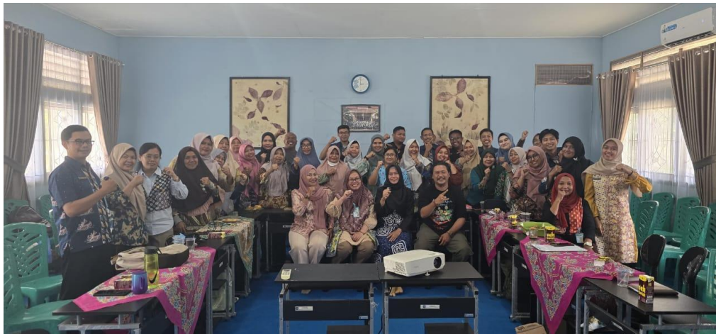
Gambar 2. Foto bersama narasumber dan peserta selesai pelatihan

Pengukuran capaian pelatihan menulis karya ilmiah para guru dilakukan dengan menggunakan pretest dan posttest dalam bentuk pilihan ganda. Hasil evaluasi kegiatan berdasarkan persentase capaian dari pretest sebelum pendampingan untuk penulisan ilmiah adalah 62%, dan posttest 90% sehingga ada peningkatan 28%. Sedangkan untuk motivasi menulis para peserta, hasil pretest 60% dan posttest 80% sehingga ada peningkatan motivasi menulis peserta sebesar 20%.