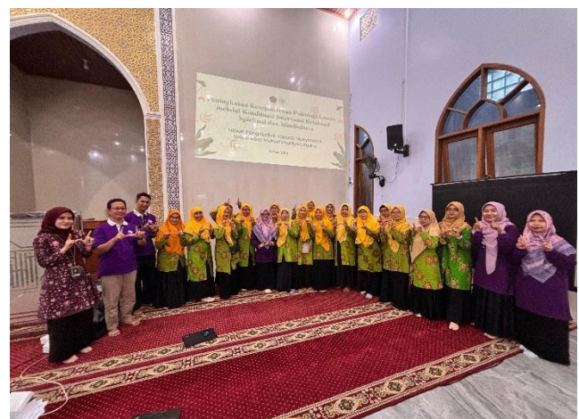
Gambar 2. Pelaksanaan Edukasi Terapi Mindfulness Dan Relaksasi Spiritual