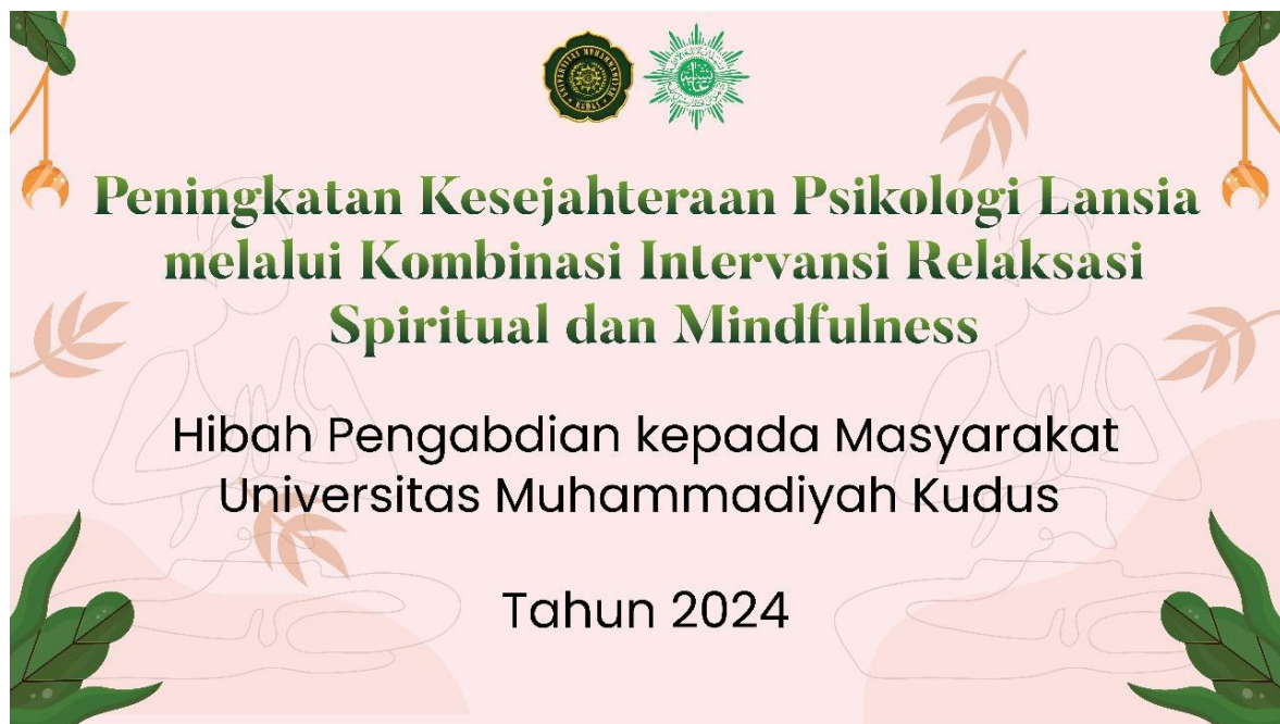
Gambar 3. Video Tutorial Mindfulness Spiritual Islam dan Relaksasi Spiritual

Pelaksanaan kegiatan edukasi terapi Mindfulness dan relaksasi spiritual berjalan dengan lancar diikuti sebanyak 35 anggota Aisyiyah berjalan dengan baik dan lancar. Pada rangkaian kegiatan pelaksanaan ini dilakukan pengukuran tingkat kesejahteraan psikologis pada lansia, edukasi pentingnya kesehatan mental pada lansia, praktek langsung pemberian kombinasi terapi mindfulness spiritual dan relaksasi spiritual, pembentukan kader, dan penayangan video tutorial mindfulness spiritual islam dan relaksasi spiritual. Video tutorial berisi panduan tahapan terapi dimulai dari niat, muhasabah, bodyscan, taubat dan doa, serta relaksasi spiritual.