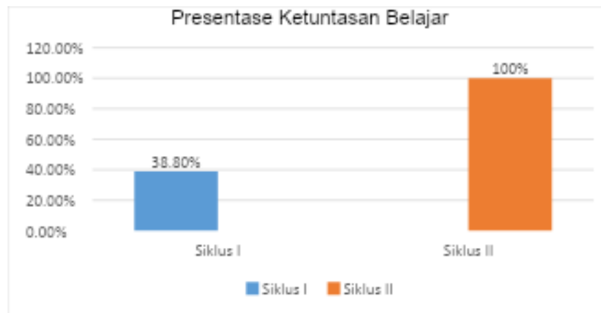
Gambar 2. Comparison of learning success rate in Siklus I and Siklus II.

Berdasarkan visualisasi grafik pada Gambar 1 dan Gambar 2, terlihat jelas lompatan perkembangan hasil penelitian yang positif. Nilai rata-rata kelas mengalami kenaikan dari 70 pada Siklus I menjadi 86,22 pada Siklus II. Selaras dengan hal tersebut, grafik tingkat keberhasilan klasikal (Gambar 2) menunjukkan pertumbuhan masif dari yang semula hanya 38,8% tumbuh secara optimal hingga menyentuh angka 100%.